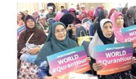
Sesibagai menyokong program yang dijalankan Rumah Ngaji demi mencapai redha Allah.