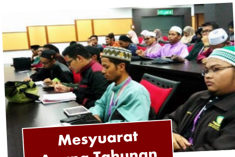
Mesyuarat Agung Tahunan