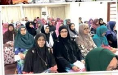
Peserta yang hadir memulakan program perniagaan dan jawatankuasa baharu persatuan.