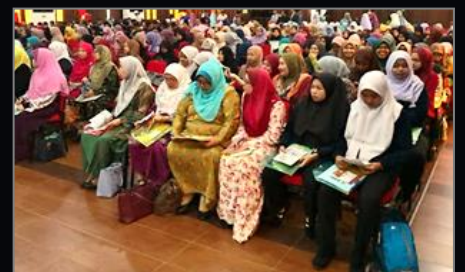
SEMINAR ISU-ISU AKIDAH DI MEDIA SOSIAL PERINGKAT IPT