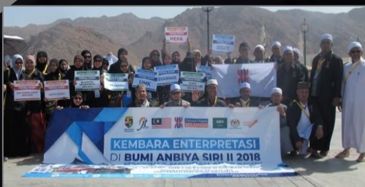
KEMBARA ENTERPRETASI BUMI ANBIYA' SIRI II MAKKAH MADINAH