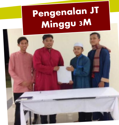
Pengenalan JT Minggu 3M