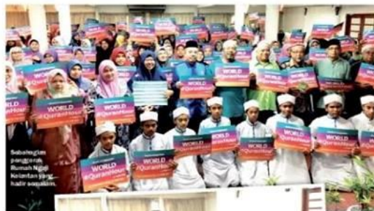
Sebahagian peserta Mesyuarat Persatuan Rumah Ngaji Kelantan yang hadir semalam.