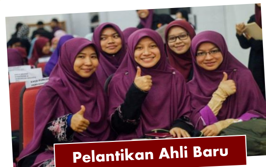
Pelantikan Ahli Baru