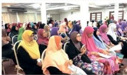
Mendekahi agar malam penubuhan Persatuan Rumah Ngaji Kelantan berjaya dilaksanakan.