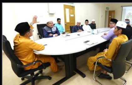
AMANAT NAIB CANSOLOR BERSAMA PUSAT ISLAM